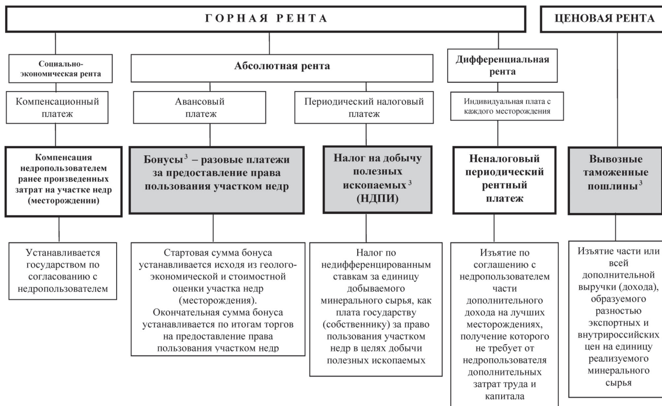
Рис. 2. Виды ренты и предлагаемая система налогообложения предпринимательской деятельности по добыче полезных ископаемых

сырья, оставляя недропользователям значительную долю ценовой ренты от продажи сырья за рубежом. Если же мы хотим стимулировать экспорт продукции второго и последующих переделов, то надо снизить вывозные пошлины на нефтепродукты, сжиженный газ, изумруды и т.п.